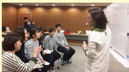
参加者の真剣な眼差しに答えようと インストラクターの指導も熱が入り .....