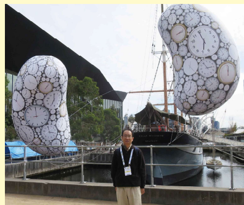
国際腎学会会場前の腎臓アドバルーン

まあ、私の趣味はともかく診療以外の学会活動や研究活動も若いDrには大事だと考えています。診療レベルの向上につながり、最終的には患者さんのためにもあると思います。当科ではこの春に国際腎臓学会で発表を行っています(写真)。NIHのように世界一を目指すわけではありませんが、世界水準の医療を提供できればと考えています。今後ともご指導ご鞭撻をお願いいたします。