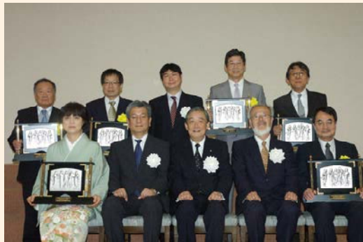
主催者と受賞病院長記念撮影

一般に自治体病院は、地域医療にとって必要な医療であれば、たとえ不採算部門であってもそれを担わなければならないので、7年連続で黒字というのは実は相当ハードルが高い基準です。そのため、平成29年度までの32年間でわずか148病院しか表彰されておりません。また、都道府県の中には、被表彰病院を輩出したことのないところもいくつかあります。和歌山県もこれまで両会長表彰を受賞した病院はありましたが、