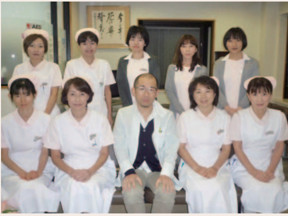
線崎泌尿器科医院