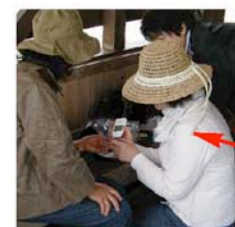
血糖値を測定するスタッフ